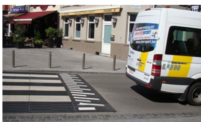
Model 10 cm